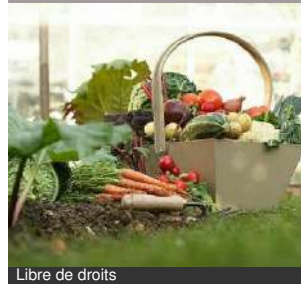
Libre de droits