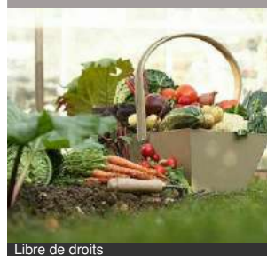
Libre de droits

le 18/08/2024 de 09h00 à 13h00 et de 09h00 à 13h00