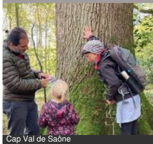
Cap Val de Saône