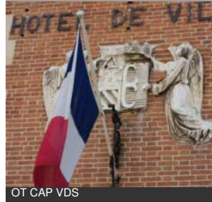
OT CAP VDS