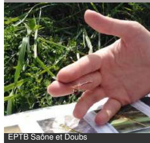
EPTB Saône et Doubs