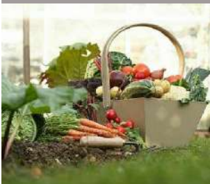
Libre de droits