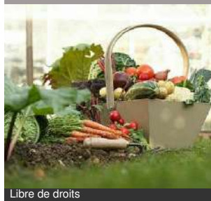
Libre de droits